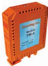
PM-A PM-S PM-P